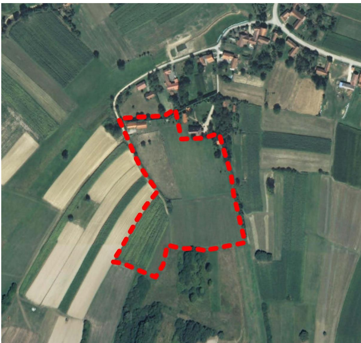
obuhvat Urbanističkog plana uređenja turističke zone Kabal

U Prostornom planu Zagebačke županije navedeno je da su prirodni preduvjeti za razvoj turističkih djelatnosti raznovrsni i atraktivni šumski i brežuljkasti predjeli, što je u ovom dijelu županije do sada slabo iskorišteno, ali kao potencijal može predstavljati važan element u planiranju razvoja turizma kako na području županije, tako i na području Općine Farkaševac.